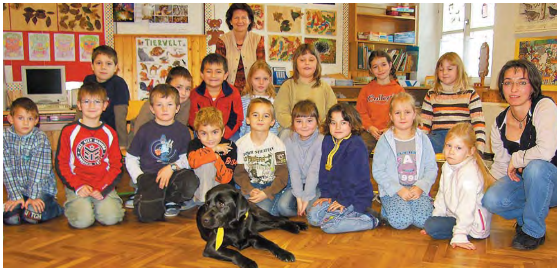
Das Projekt fand bei den Lehrern und den Kindern besonders großen Anklang.

Auf Fragen wie „Warum soll man ruhig stehenbleiben, wenn ein Hund auf einen